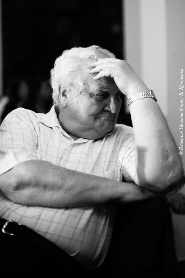
© Вячеслав Иванов. Фото: В. Ярошенко